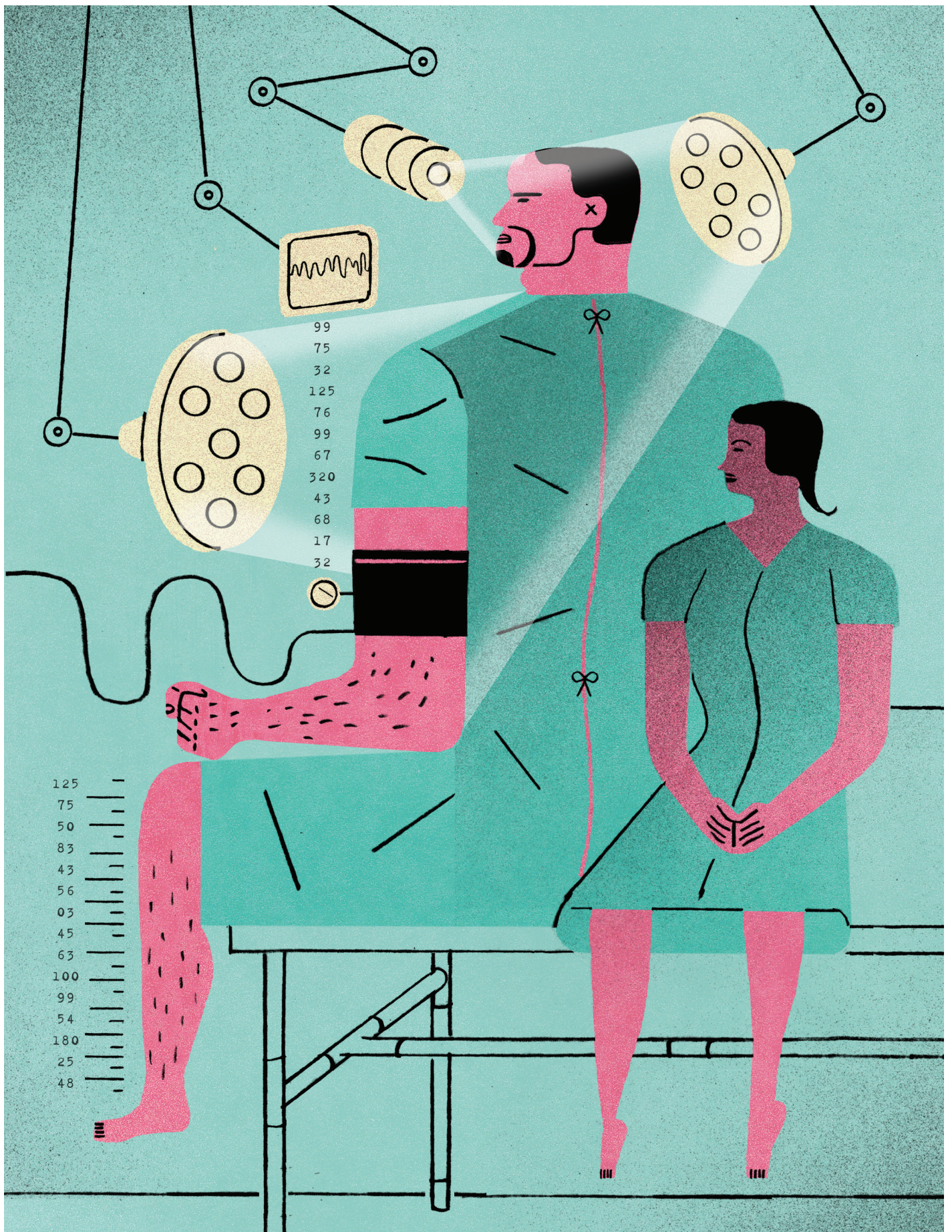
イラスト: デビッド・ブランカート